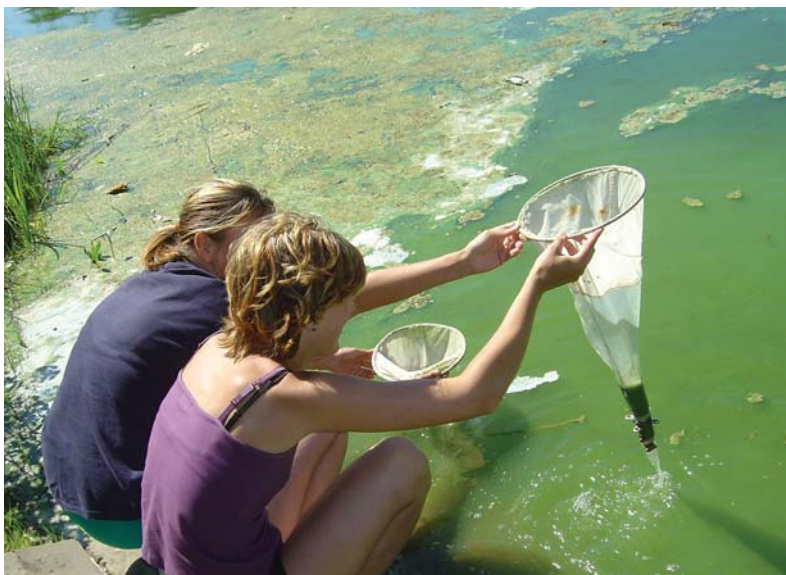
Toksisko zilaļģu ziedēšana Lielajā Baltezerā 2006. gada augustā.

Toksisko zilaļģu „ziedēšana” Latvijas ezeros un ūdenskrātuvēs, kā arī Rīgas līcī tiek novērota katru gadu, taču tās intensitāte ir atšķirīga. Piemēram, 2000.-2001. gados tikai divos no Latvijas Vides Aģentūras apsekotajiem 40 ezeriem tika konstatēta izteikta toksisko zilaļģu „ziedēšana”, bet 2002. gadā intensīva „ziedēšana” reģistrēta