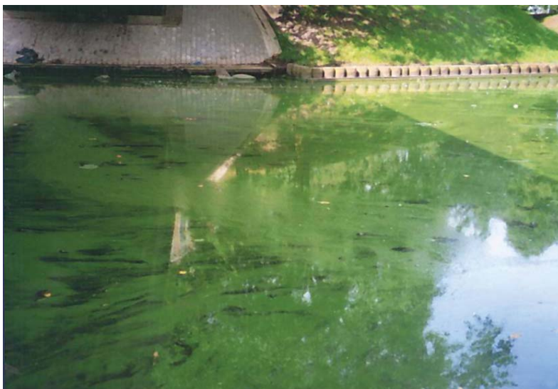
Toksisko aļģu akumulācija Rīgas kanālā 2002. gada augustā.

Ūdens „ziedēšanu” izraisa aļģu masveida savairošanās. Ūdens virspusē veidojas bieza aļģu masa, kuras krāsa variē no tumši zaļas līdz dzeltenbrūnai. Aļģu slānim izzūstot, pludmalē nereti novērojamas zilizaļas svītras, kas atgādina izlietu krāsvielu. „Ziedēšanu” pavada nepatīkama smaka, kas rodas pūstot atmirušajām aļģēm. Ūdens „ziedēšanas” laikā samazinās ūdens dzidriība un vidē sākas pūšanas procesi. Pūšana izraisa strauju skābekļa patēriņu un tā trūkumu ūdenī, kam seko citu ūdens organismu saindēšanās un bojāeja, vidē izdaloties pūšanas produktiem.