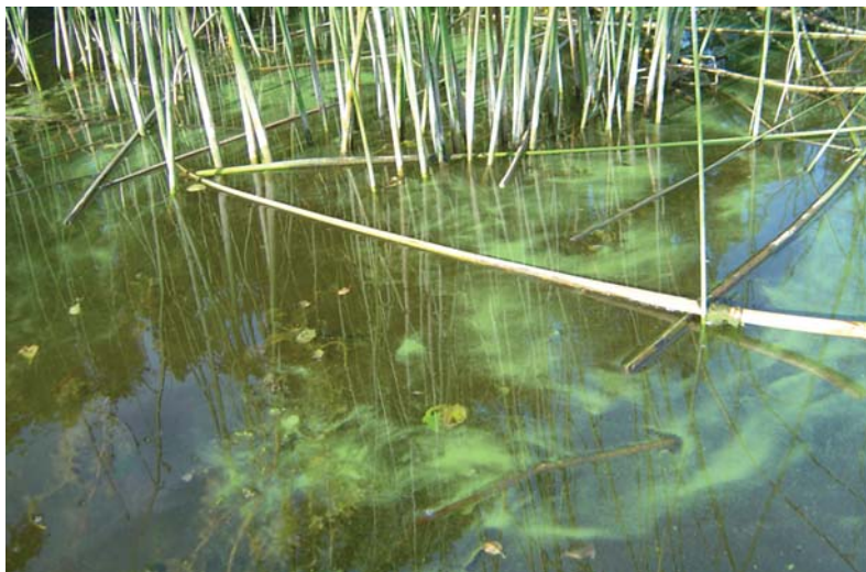
Ūdens ziedēšana Mazajā Baltezerā 2006. gada augustā. (Foto M.Balode)

Aļģu savairošanos veicina silts ūdens (virs 16°C), mierīgs laiks un pietiekamas barības elementu koncentrācijas ūdenī. No barības elementiem vissvarīgākie ir slāpeklis un fosfors. Slāpeklis ūdenstilpēs nonāk izskalojoties ar lietus ūdeņiem no mēslojamām lauksaimniecības zemēm un dārziem, no nepareizi izveidotām kūtsmēsļu glabātuvēm, kā arī ar neatīrītiem sadzīves notekūdeņiem un no privātmāju notekūdeņu iesūcināšanas laukiem. Fosforu labi aiztur augsne, tādēļ ūdenstilpēs tas nonāk galvenokārt ar sadzīves notekūdeņiem. Daudz fosfora ir ķīmiskajos mazgāšanas līdzekļos.