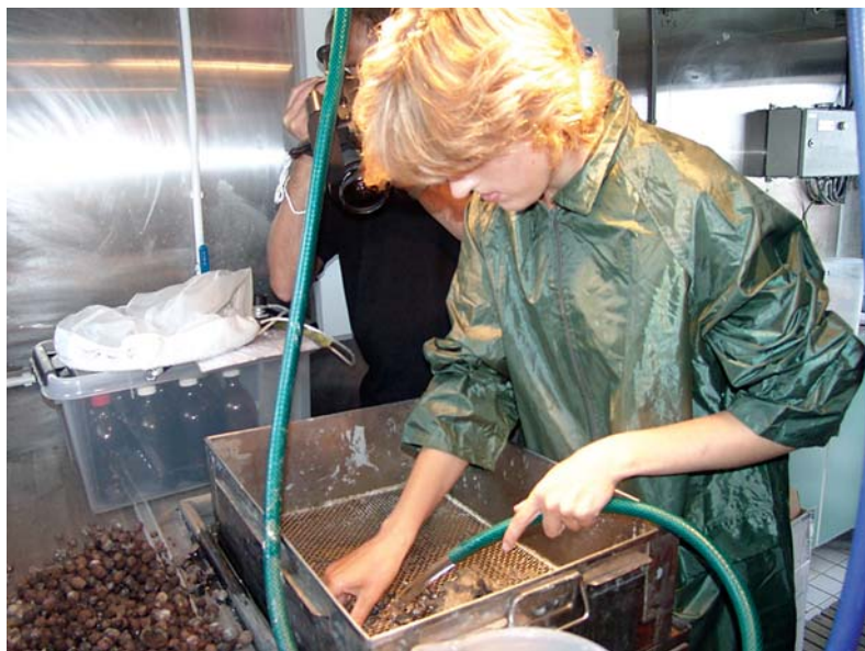
Molusku ievākšana zilaļģu toksīnu analizēm.

Toksisko aļģu pētījumi Latvijas saldūdeņos aizsākti 1997. gadā Mazajā un Lielajā Baltezerā. Kopš 2002. gada, zinātnisku projektu ietvaros, regulāra toksisko aļģu un toksīnu kontrole tiek veikta vairākos Rīgas un Pierīgas ezeros (Lielajā un Mazajā Baltezerā, Langstiņu ezerā, Ķīšezerā, Juglas ezerā, Rīgas HES ūdenskrātuvē u.c.). Konstatēta cieša sakarība starp toksisko aļģu „ziedēšanas” intensitāti un augstām neorganiskā fosfora un ūdenī izšķīdušā organiskā slāpekļa koncentrācijām. Deviņdesmit procentos apsekojamo ūdenstilpju tika konstatēta potenciāli toksisko zilaļģu masveida attīstība un 73% – aļģu toksīnu klātbūtne, ar augstākajiem rādītājiem Rīgas ūdenskrātuvē un Lielajā