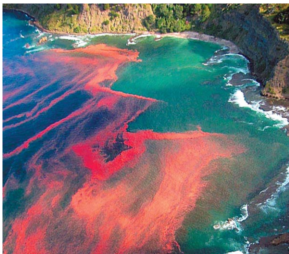
“Sarkanie uzplūdi” pie Jaunzēlandes krastiem.

Okeānos un jūrās sastopamas daudzas toksisko dinoflagellātu un kramaļģu sugas, kas savairojoties izraisa t.s. „sarkanos uzplūdus” („red-tide”). Pirmo reizi šāds fenomens pieminēts jau Bibēlē. Savukārt, visu kontinentu saldūdeņos sastopamas galvenokārt toksiskās zilaļģes, kas